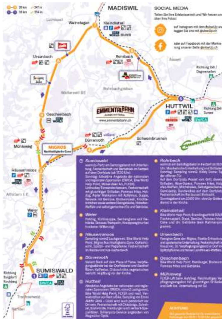
Streckenkarte und Angebot dient als Muster (slowUp Emmental-Oberaargau 2023)

Die 38-km-Strecke mit Start in Hüttwil über Kleindietwil, Häusermooos, Sumiswald und zurück über Dürrenroth nach Hüttwil ist am Sonntag, 8. September 2024 von 10 bis 17 Uhr für den motorisierten Verkehr gesperrt. Der Rundkurs ist im Gegen-Uhrzeigersinn zu befahren. Ausnahme: Der Abschnitt Sumiswald – Häusermooos kann in beide Richtungen befahren werden. An den zwei Stellen mit etwas Gefälle vom Mühleweg (Oeschenbach) runter und kurz nach Sumiswald werden Velofahrer mittels Tafeln aufgefordert, Inline-Skatern ihre Hilfe anzubieten.